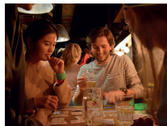
Borrels en feesten